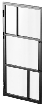
Antaba z pochwytem bez zamka