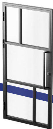
Antaba z pochwytem i zamkiem

Klamkę można zastąpić stalową, pionową antabą (do wyboru wersja z zamkiem baryłkowym lub bez zamka). Drzwi posiadają stalowe, wstawane, łożyskowane zawiasy gwarantujące ich płynną pracę.